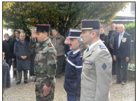
Militaires et anciens combattants

Mairie de Châtillon le Duc Tél. 03 81 58 86 55 Fax 03 81 58 70 63 @mail: mairie@chatillon-le-duc.fr site Internet : www.chatillon-le-duc.fr Ouverture secrétariat : Lundi et vendredi : 8h30-11h30 - mercredi : 8h30-11h30 - vendredi 13h30-17h00 et samedi : 9h-11h30