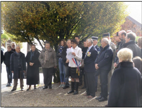
Lecture des textes officiels

Les cérémonies sont des moments solennels, de mémoire, au cours desquels, élus nationaux, départementaux et communaux, militaires, anciens combattants, Mme la Principale du collège, le Président et les membres de l'association du souvenir français, associés aux habitants se retrouvent pour ne pas oublier.