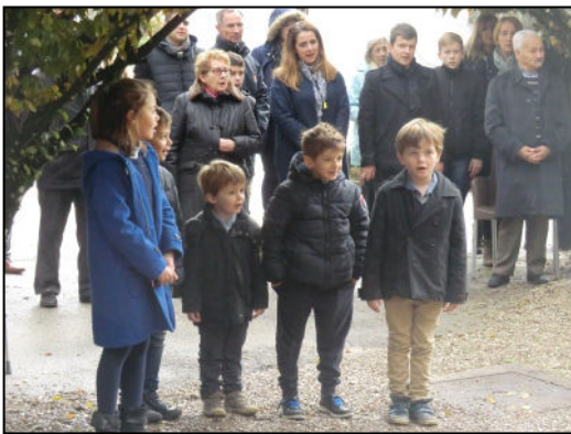
Jeunes enfants particulièrement attentifs

Nous souhaitons qu'en 2017 les enfants des écoles se joignent nombreux aux cérémonies du souvenir.