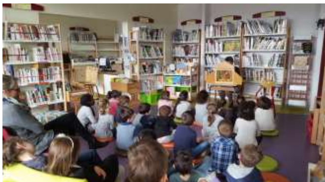
Un exemple de lecture à l'aide d'un kamishibai